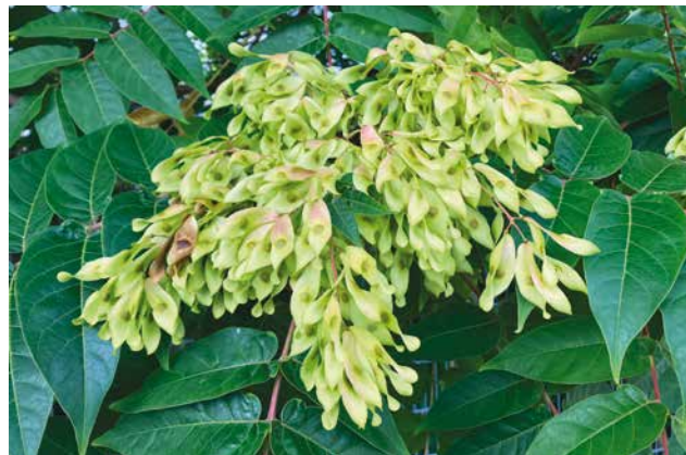
Samenstand eines weiblichen Götterbaums