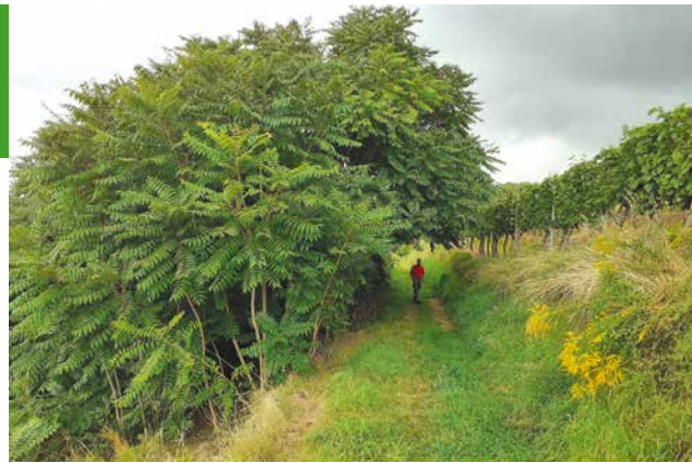
In kurzer Zeit hat der Götterbaum ein ungepflegtes Grundstück erobert

Im Zweifel ziehen Sie bitte einen Pflanzenkenner hinzu.