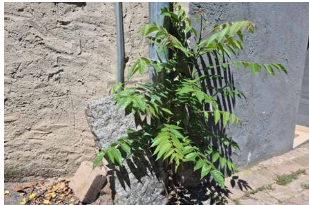
Ansiedlung am Mauerfuß – Schäden sind vorprogrammiert