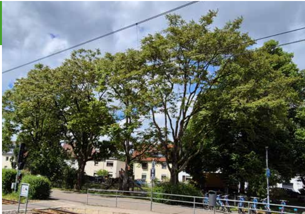
Markante Bäume in der Siedlung können fallweise erhalten bleiben.