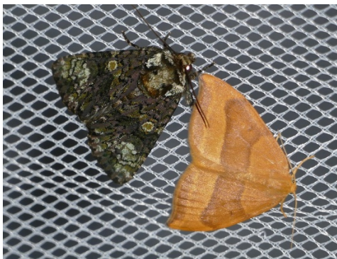
Liguster-Rindeneule (links) und Buchen-Sichelflügler, zwei häufige Nachtfalter am Blütenweg.

Die Schmetterlingsfauna am Blütenweg verändert sich durch die trockenen Sommer der letzten Jahre und durch den Klimawandel. Letzterer verdrängt manche Arten in höher gelegene Lagen, wie den „Kleinen Fuchs“. So manche standorttreue Schmetterlingsart wird hier erst selten und dann aussterben. Andere, wanderfreudige Arten, kommen aus dem Mittelmeerraum zu uns und können sich hier etablieren. Dies gelang z. B. dem Taubenschwänzchen, bekannt durch seinen Kolibriartigen Flug. Die Trockenheit dagegen führt zum lokalen Aussterben von Schmetterlingen. Entweder vertrocknen die Nahrungspflanzen der Raupen, oder die Falter finden keinen Nektar mehr, weil Blumen nicht mehr so regelmäßig und lange blühen. Dies betrifft Arten des Offenlandes und der Waldränder.