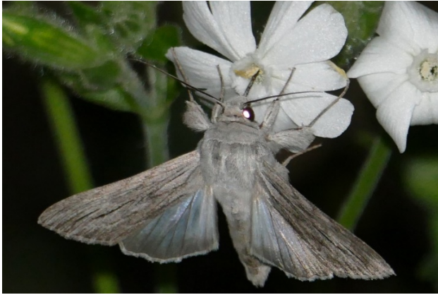
Der Rainfarn-Mönch, Rote Liste 2, eine „Sensation“ am Blütenweg